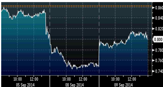
파운드화 달러화대비 환율